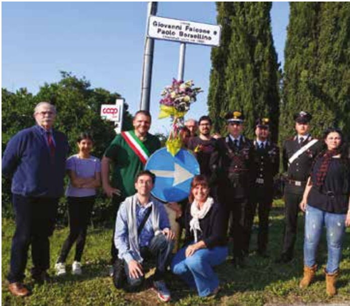
Commemorazione della giornata della legalità e ricordo della strage di Capaci sulla rotonda intitolata a Falcone e Borsellino