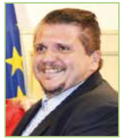
LUCA LELLI SINDACO