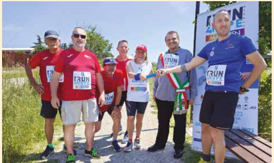
Cambio del testimone a Ozzano per la steffetta podistica a scopo benefico Run4Hope