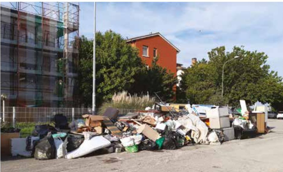
Materiale danneggiato dall'alluvione - Ponte Rizzoli

Come detto in sede di Consiglio comunale a fine giugno, colgo anche qui l'occasione per riconoscere il merito all'intera struttura comunale, ciascuno per le proprie funzioni e competenze, per la tempestività, disponibilità e responsabilità con cui si sono affrontate le necessità di questo periodo e che ancora coinvolgono il Comune ora impegnato nel compito di "sportello" per le informazioni e il ricevimento delle richieste da parte dei cittadini e cittadine sui primi contributi pubblici emanati.