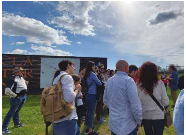
FAI - Visita agli scavi di Claterna

«Queste Giornate sono state per noi una bella occasione per mostrare l'Italia più bella, fatta di luoghi emozionanti, interessanti, creati con impegno, cuore e dedizione, che danno molto al territorio circostante e non solo. L'obiettivo delle Giornate FAI è promuovere