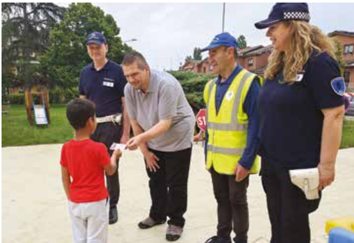
Educazione stradale alla scuola dell'infanzia comunale G. Rodari