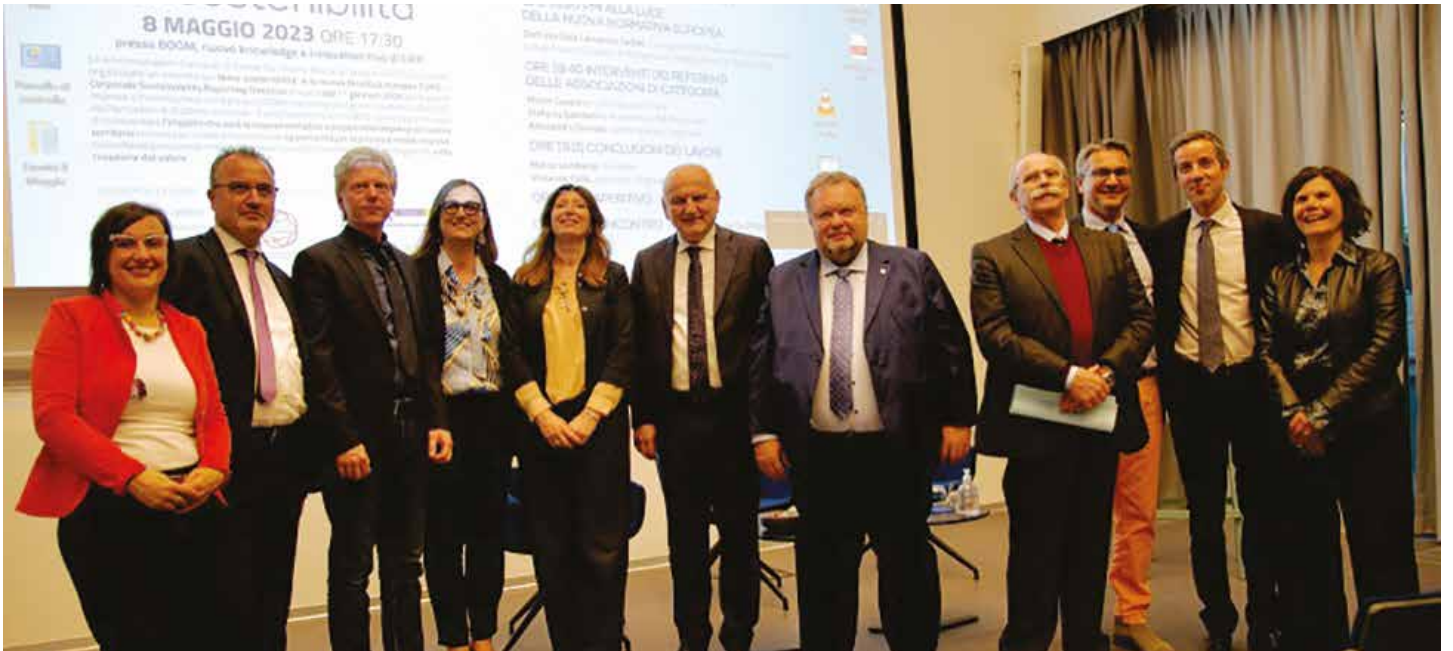
8 maggio 2023: Convegno BOOM sostenibilità

D a tempo si parla della necessità di affrontare la vita quotidiana, di guardare il nostro futuro e le nostre aspettative lavorative con un'attenzione particolare e con un occhio alla sostenibilità ambientale, economica e sociale. Le grandi imprese (così definite quelle con oltre 250 dipendenti) sono chiamate, dal prossimo anno, quindi dal 2024, ad attuare tutte le misure necessarie affinché questi temi rientrino a pieno titolo nelle strategie aziendali. Si tratta di obiettivi che riguardano anche la soddisfazione del dipendente, le condizioni e gli orari di lavoro, l'attenzione nell'approvvigionarsi di materie prime non inquinanti e la stesura di bilanci eco-sostenibili. E questo approccio alla nuova normativa toccherà anche le piccole e medie imprese. Come Amministrazione comunale, in sinergia col Comune di Castel San Pietro Terme abbiamo organizzato un importante incontro presso la struttura BOOM a Osteria Grande per affrontare anche questi ulteriori importanti temi: la riduzione delle emissioni di gas serra; il