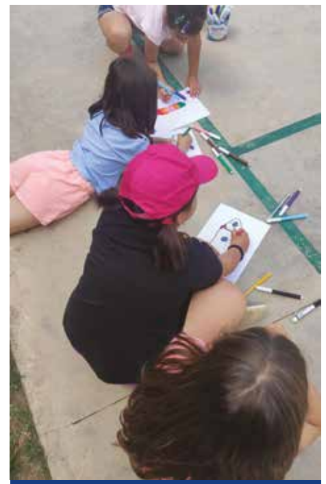
Centro estivo presso la scuola primaria Ciari del Capoluogo