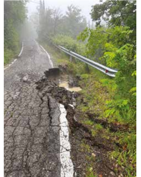
Frana del versante sotto la sede stradale di via Poggio - Ciagnano

Una prima ricognizione - richiesta anche dalla Regione Emilia-Romagna a inizio