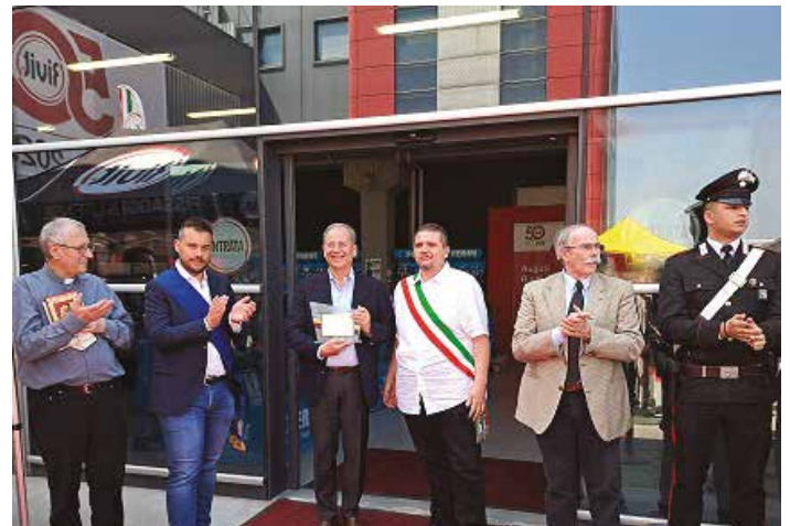
Festeggiamenti per i 50 anni della ditta RIVIT