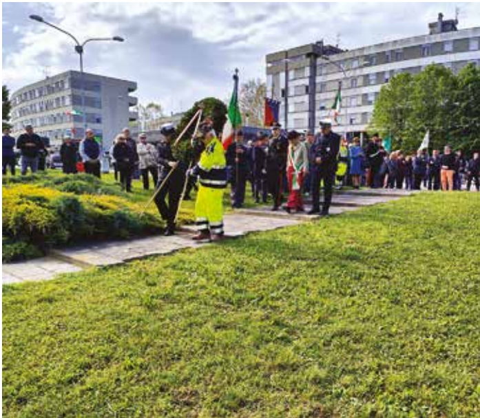
25.04.2023 - Deposizione della corona in onore dei caduti durante la celebrazione della Festa di Liberazione