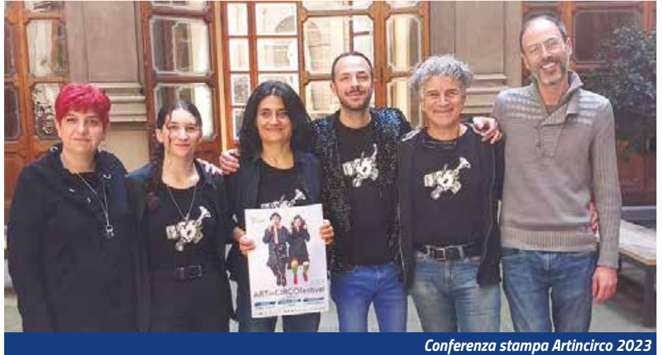
Conferenza stampa Artincirco 2023

Ad aprire il mese di agosto ci sarà il concerto degli Oblivion, che insieme agli ap-