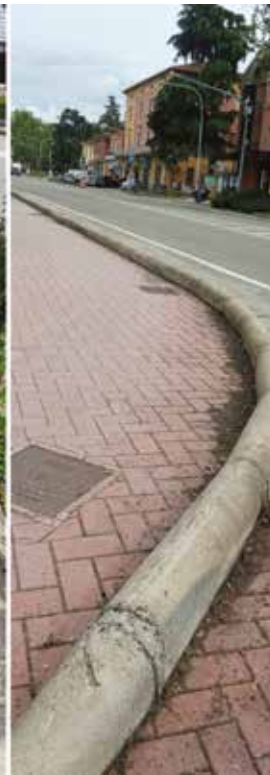
Marciapiedi - prima e dopo