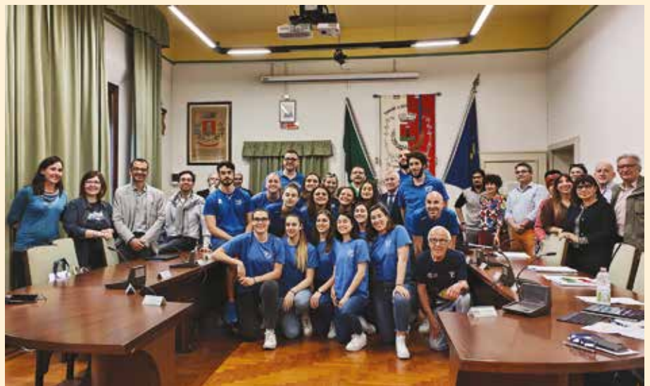
Festeggiamenti in sala consiliare per la pallavolo femminile Fatro Ozzano promossa in B1