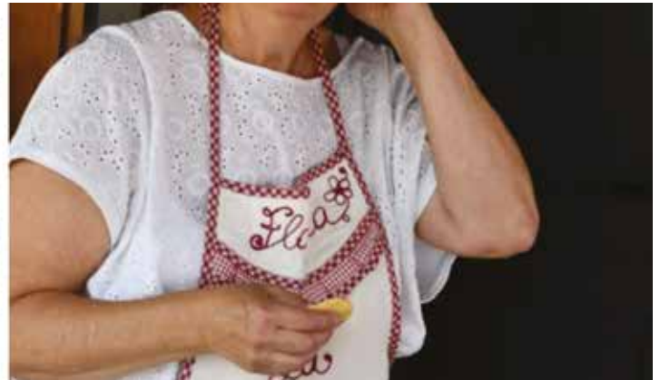
Sagra dell'Imbutino 17 e 18 giugno 2023 - nel cuore della festa

D i sagre ce ne sono tante, ma alcune sono più particolari, lasciano una sensazione piacevole, un ragionamento da fare, come alla fine di un gran bel film.