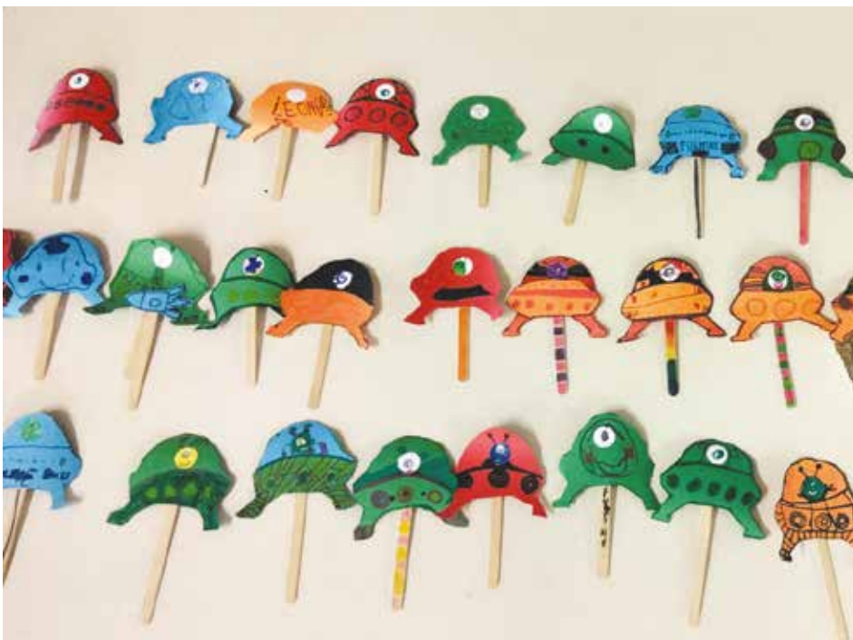
Lavoretti fatti al Centro estivo presso la scuola primaria Ciari del Capoluogo

Buone vacanze a tutti gli studenti e alle loro famiglie, ai docenti e a tutto il personale scolastico.