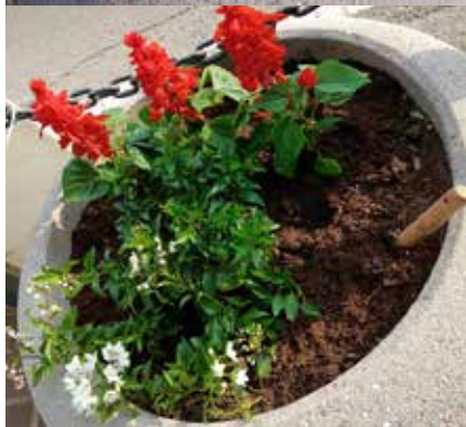
prima e dopo