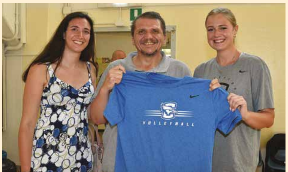
Amichevole pallavolo femminile Fatro Ozzano-Creighton University Nebraska Consegna al Sindaco della maglia ricordo da parte della capitana americana