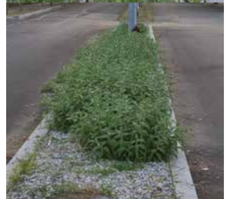
Viale 2 Giugno - prima e dopo

D al marzo scorso è operativo, sul territorio, il gruppo di volontari e cittadinanza attiva denominato "AmOzzano e me ne prendo cura". Lo scopo dei cittadini che hanno aderito a questo gruppo è quello di adoperarsi per rendere più bello e pulito Ozzano, il loro e il nostro paese.