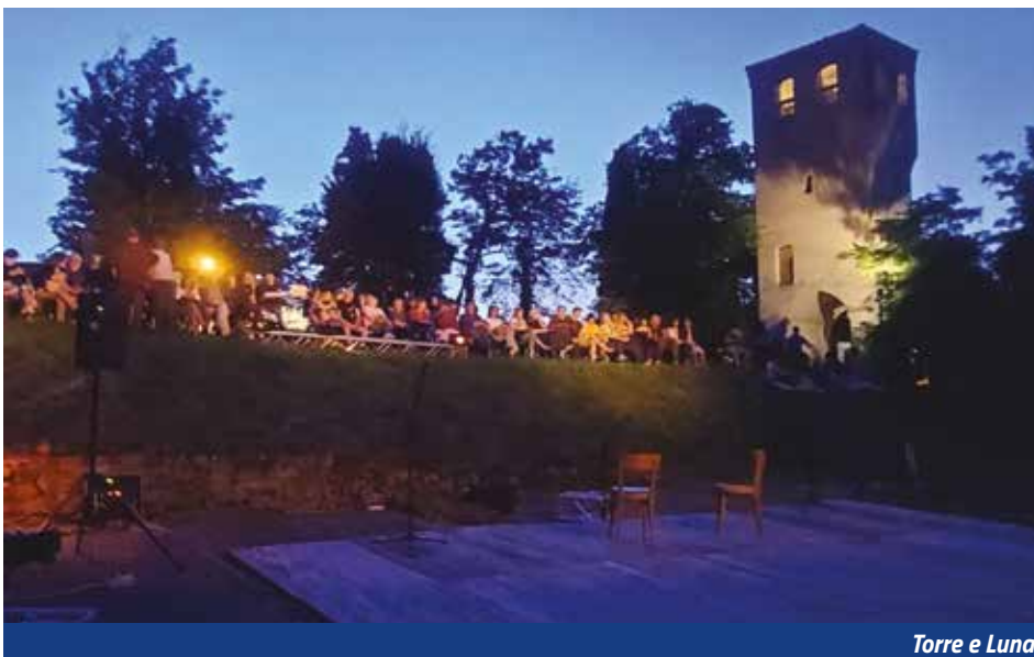
Torre e Luna

Al concetto di comunità che si ritrova in momenti di condivisione culturale, va affiancato il concetto di welfare culturale, basato anche su progetti di inclusività, come quello che stiamo sperimentando per le visite al Museo e anche in collaborazione con la Paciu Maison con visite in LIS. Gli eventi culturali vanno osservati a 360°, per il loro grande potenziale, vanno vissuti e bisogna per quanto possibile goderne. Un territorio che sostiene la cultura e l'aggregazione è un territorio vivo.