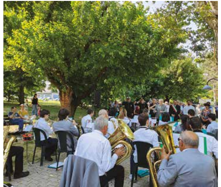
Celebrazione 2 giugno Festa della Repubblica - Il concerto nel parco