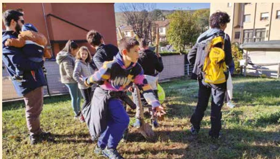
Albero di San Martino - un momento della piantumazione degli alberi a cui hanno partecipato anche gli alunni della classe 1 E delle medie Panzacchi