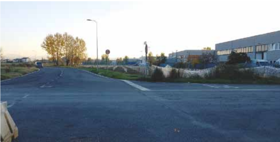
Intervento di forestazione in area limitrofa alla zona artigianale

L'intero progetto di forestazione urbana "Mettiamo radici per il futuro" ora attuato nelle aree verdi pubbliche di Ozzano per circa 47.200 mq, dunque, ci accompagnerà nella sua evoluzione naturale così che dei diversi interventi realizzati se ne potrà godere appieno negli anni a venire.