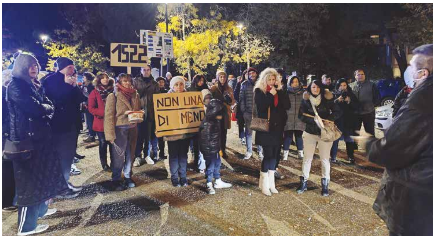
25.11.2023 - Giornata contro la violenza alle donne - Corteo rumoroso da Piazza Allende fino al piazzale del Municipio

Queste tematiche, sviluppate in maniera sintetica, sono obiettivi che vanno in continuità con quanto fatto fino ad ora. E' fondamentale che ci sia una continuità per poter dare stabilità sia ai progetti che ai servizi dati, questo non esclude che possano essere inseriti ulteriori elementi di novità, che possono nascere da un confronto costante con la comunità.