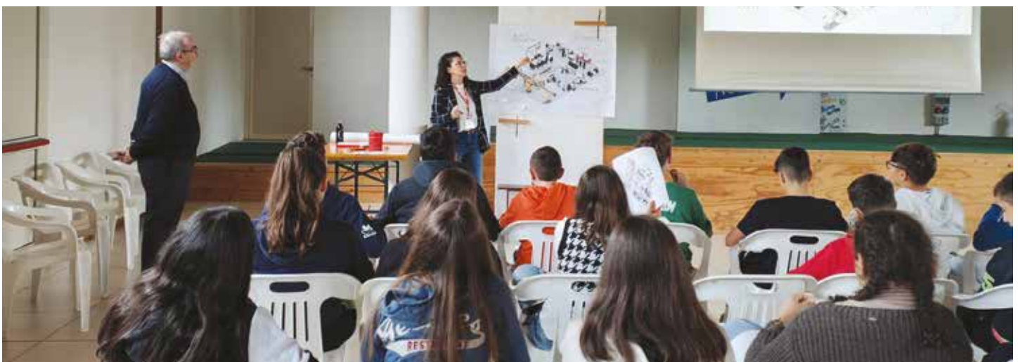
Ottobre 2023 - IMA incontra i ragazzi delle scuole "E.Panzacchi"

I migliori auguri per un sereno Natale ed un "proficuo" 2024 a tutti voi.