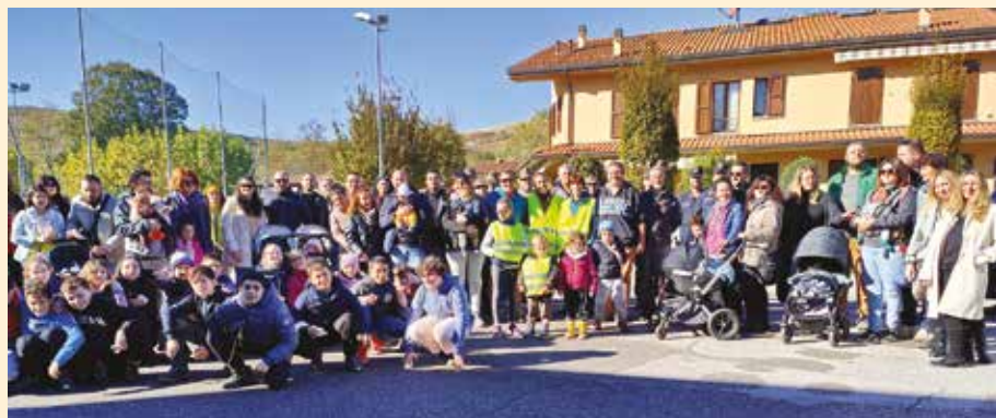
Albero di San Martino - foto di gruppo delle famiglie con i loro bimbi

Al termine della piantumazione alle famiglie sono state consegnate delle pergamene ricordo con il nome del loro bimbo/a ed il tipo di alberello a lui o lei dedicato.