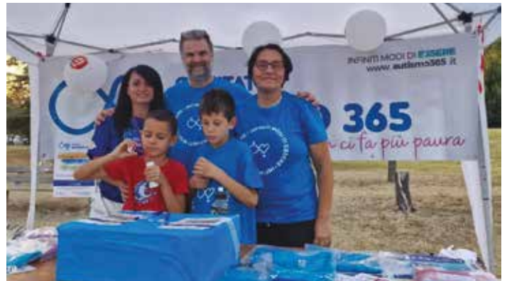
Comitato Autismo 365

N onostante il tempo non abbia aiutato, l'Amministrazione non ha abbandonato l'idea di voler far trascorrere due belle giornate alla cittadinanza. Armata di pazienza e volontà, ha indetto due tavoli di co-progettazione con le società sportive per renderle protagoniste attive della Festa dello Sport.