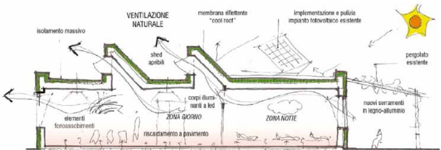
Illustrazione del sistema di ventilazione naturale all'interno delle sezioni del Fresu (dal progetto)