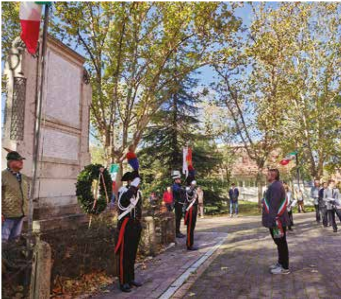
Celebrazione del 4 novembre: Deposizione di una corona al monumento ai Caduti di tutte le guerre