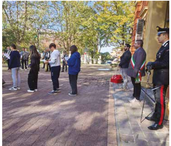
Celebrazione del 4 novembre: Lecture dei ragazzi delle classi 3 B e D della scuola secondaria di primo grado E. Panzacchi