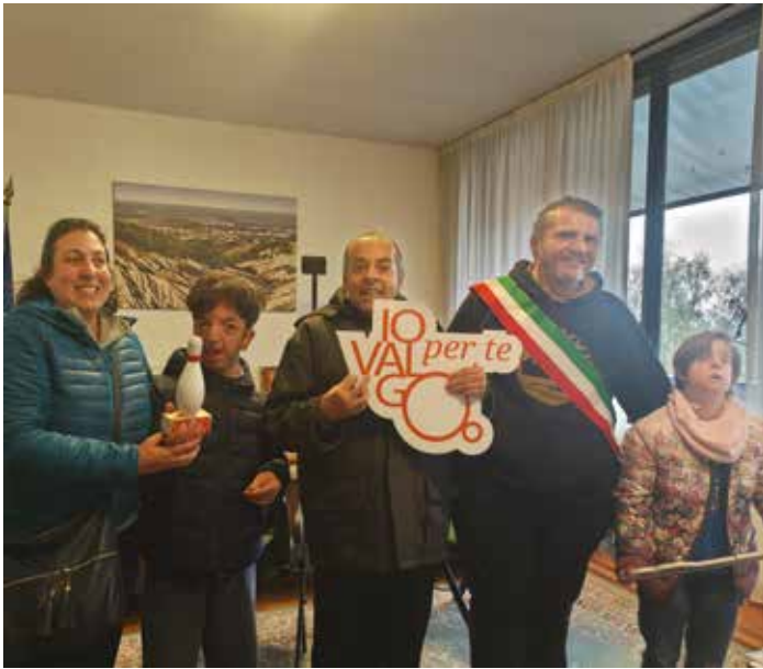
Il Sindaco insieme ad alcuni ospiti della Fraternità per il progetto IO VALGO PER TE