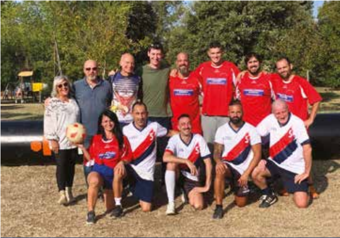
La squadra di calcio degli Amici del CEV di Ozzano

Un doppio ringraziamento va a tutti gli sponsor che ci hanno sostenuto affrontando doppiamente le spese organizzative, causate dal rinvio dell'iniziativa da maggio a settembre 2023 per colpa dell'alluvione che ha colpito purtroppo il nostro paese.