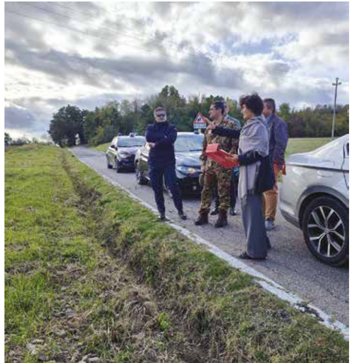
Alcuni momenti della visita del Gen. Figliuolo e del suo staff sul nostro territorio