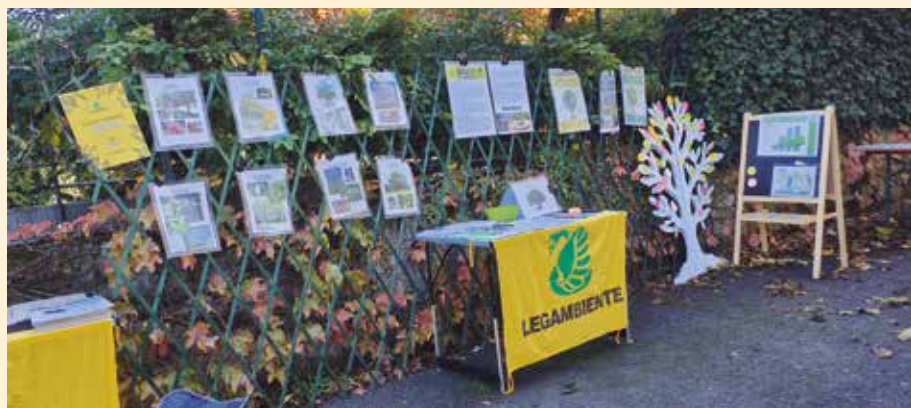
Albero di San Martino - Il banchetto di Legambiente che ha partecipato alla cerimonia