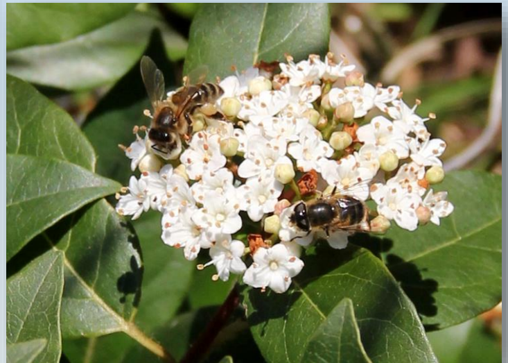
Ape e sirfide su viburno laurotino

Per ulteriori informazioni è possibile contattare i tecnici del C.A.A. "Giorgio Nicoli" S.r.l. (051/6802227) rferrari@caa.it