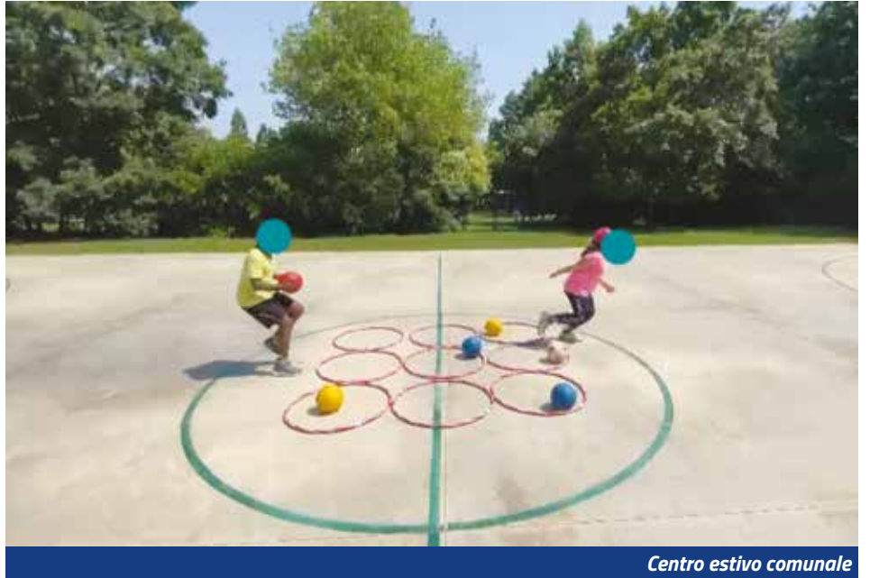
Centro estivo comunale

Con la chiusura dell'anno scolastico, che anche quest'anno ha richiesto un notevole sforzo per riuscire ad operare in un contesto emergenziale inizia, come di consueto, la stagione dei Centri estivi, un periodo di divertimento e spensieratezza del quale i nostri bambini e bambine hanno certamente bisogno. Il Centro estivo proposto dall'Amministrazione comunale è gestito, quest'anno, dalla Soc. Coop. Dolce, vincitrice dell'attuale concessione; ma accanto alla proposta comunale, siamo soddisfatti di vedere che diversi soggetti privati hanno deciso di investire sul territorio "aprendo" altri Centri estivi; siamo fermamente convinti che una maggiore possibilità di scelta per le famiglie si traduca in un servizio più efficiente e vicino alle necessità di tutta la comunità. Per questo motivo vorrei ringraziare tutti coloro che si stanno impegnando sul nostro territorio, arricchendo l'offerta legata ai centri estivi: Sport Club, Karabak Sette, Pallavolo Ozzanese, Educando Soc. Coop., Educare