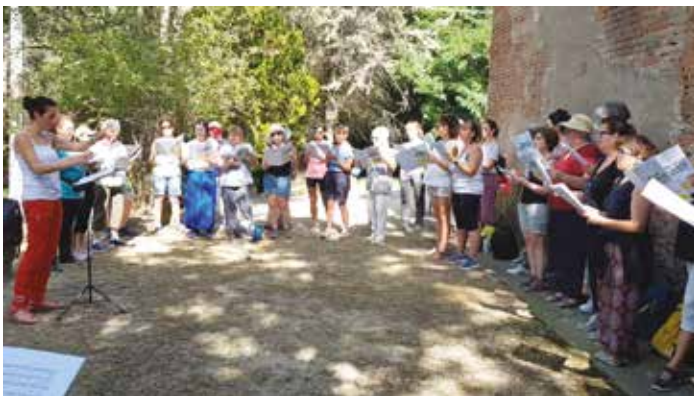
Sabato 18 giugno si è svolto il Trekking Corale del Festival OzzanoInCanto 2022 5ª edizione, patrocinato dal Bando Cultura del Comune di Ozzano dell'Emilia. Nello scatto un momento della sosta canora presso l'Oratorio di Ciagnano

E' il versante questo dell'inclusione delle persone svantaggiate,