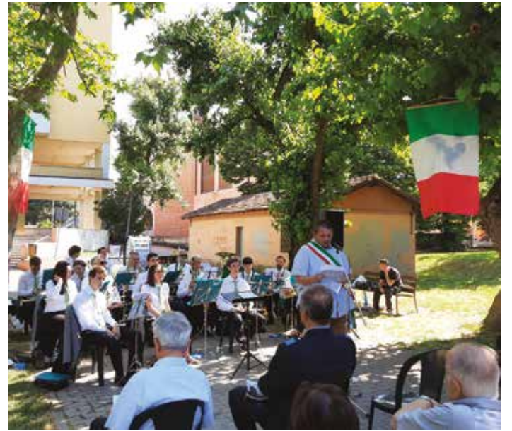
2 giugno 2022: il discorso del Sindaco per la celebrazione della Festa della Repubblica