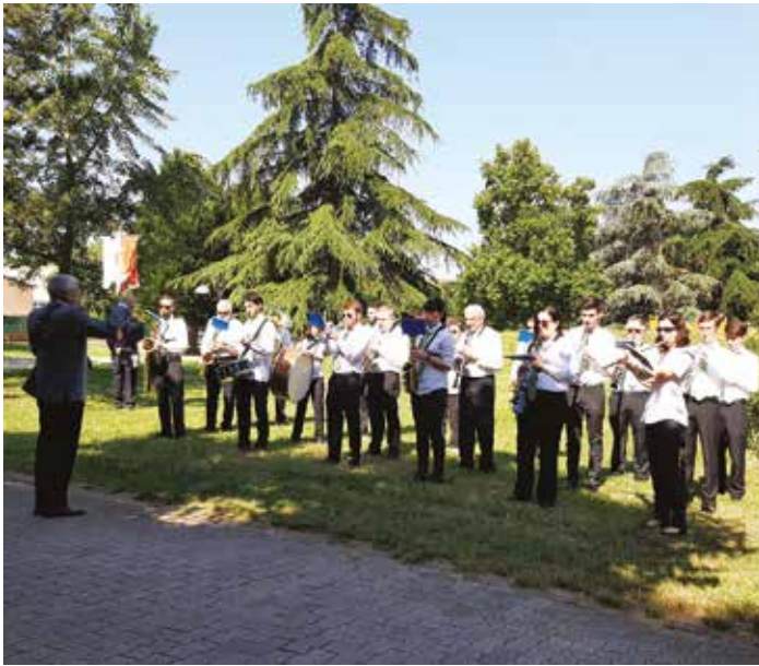
2 giugno 2022: concerto nel parco per la celebrazione della Festa della Repubblica