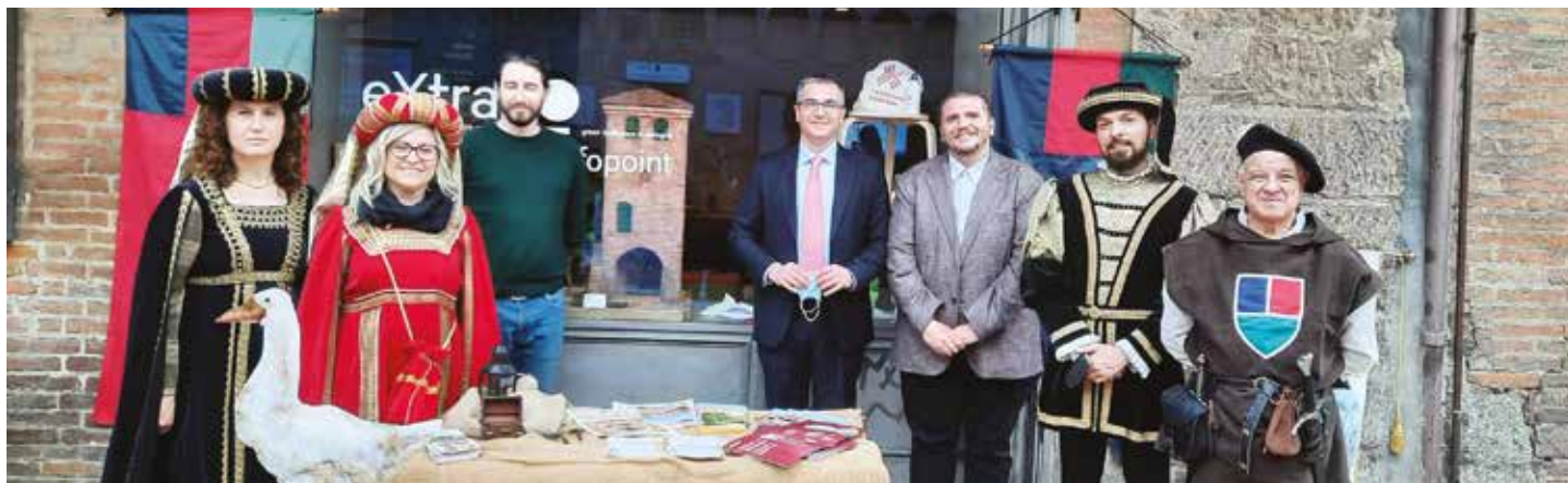
OZZANO protagonista sul palco di Cibò So Good a Palazzo Re Enzo e ad ExtraBo in Piazza Nettuno