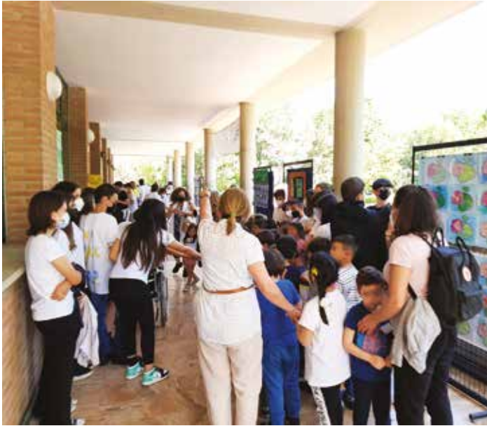
12 maggio 2022: un momento della Festa del libro edizione 2022