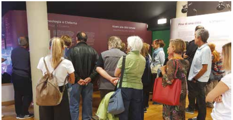
21.9.2019 giornate europee del patrimonio visite agli scavi e al museo città romana di Claterna

Le visite guidate sono accompagnate da laboratori per i più piccoli, per farli toccare con mano (nel vero senso della parola) la storia. Questa programmazione è resa ancor più ricca con la nostra adesione a giornate importanti come la Festa del Libro, Giornate Europee dell'Archeologia, Giornate Europee del patrimonio e Festa della Storia.