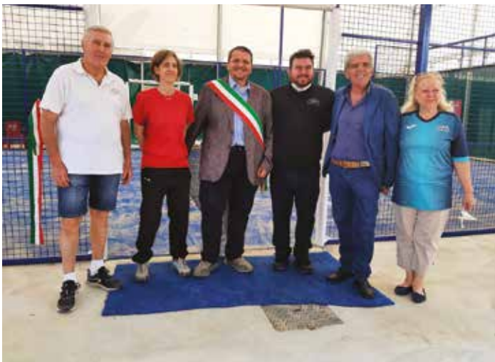
14.05.22 - Lo staff dello Sport Club Ozzano con il Sindaco Luca Lelli

pubblico lo merita. Vi saluto segnalandovi che in allegato a questo periodico trovate la guida informativa alla protezione civile elaborata dalla nostra unione dei comuni, uno strumento pratico che contiene informazioni importanti da tenere pronto, in caso di necessità. Ringraziando chi ci ha lavorato, vi auguro buona estate!