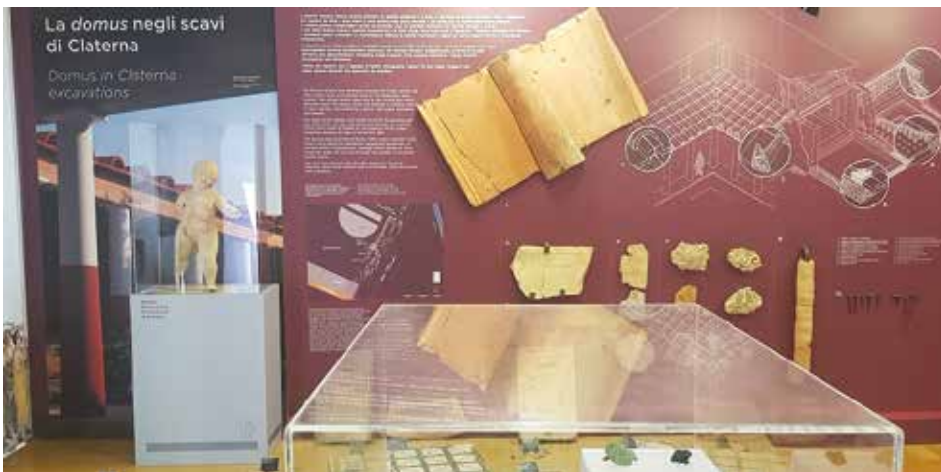
Sala museo Claterna

Possono sembrare dei ringraziamenti scontati o per pura forma, in realtà sono importanti perché non dobbiamo dimenticarci che ogni cosa nasce e diventa forte grazie ad una squadra che lavora per lo stesso obiettivo, in questo caso la nostra storia.