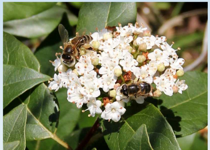
Ape e sirfide su viburno laurotino

Per ulteriori informazioni è possibile contattare i tecnici del C.A.A. "Giorgio Nicoli" S.r.l. (051/6802227) rferrari@caa.it